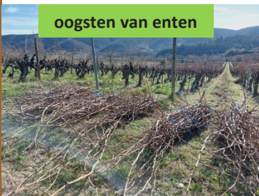
oogsten van enten

Verschillende virologische tests verzekerden ons ervan dat het hout ziektevrij is. In maart 2024 vond de enting plaats waarna de enten vanaf mei 2024 in een privé kwekerij geplaatst werden.